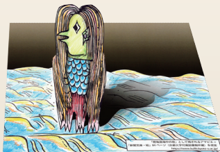
自由に塗った場合