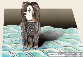
同系色で塗った場合